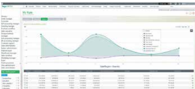
Monitoraggio del magazzino che identifica le anomalie

Sapevi che ci vogliono in media 11,5 giorni perché vengano notificati ai manager di aziende piccole e medie eventi che stanno impattando il loro business? 4 Una buona intelligence e l'accesso in tempo reale ai dati, insieme all'abilità di ricevere notifiche e avvisi, può ridurre questo lasso di tempo a quasi zero.