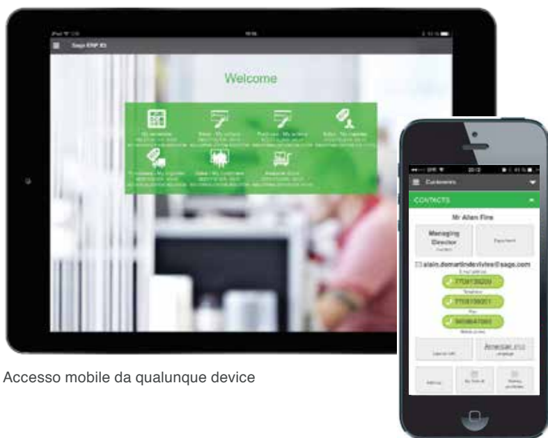
Accesso mobile da qualunque device