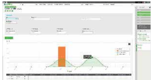
Inventario disponibile e programmato per sito

Sia che tu abbia una sola sede o diverse filiali in tutto il mondo, Sage ERP X3 si amplia insieme alla tua azienda. La scalabilità rende semplice aggiungere utenti, con nuovi profili e workflow di processo, mentre anche i nuovi dipendenti possono essere aggiunti velocemente. Ti stai espandendo in una nuova area o mercato? Sage ERP X3 facilita le cose, grazie all'inclusione di funzionalità multi-sito, multi-azienda, multi-valuta, multi-legislazione e multi-lingua.