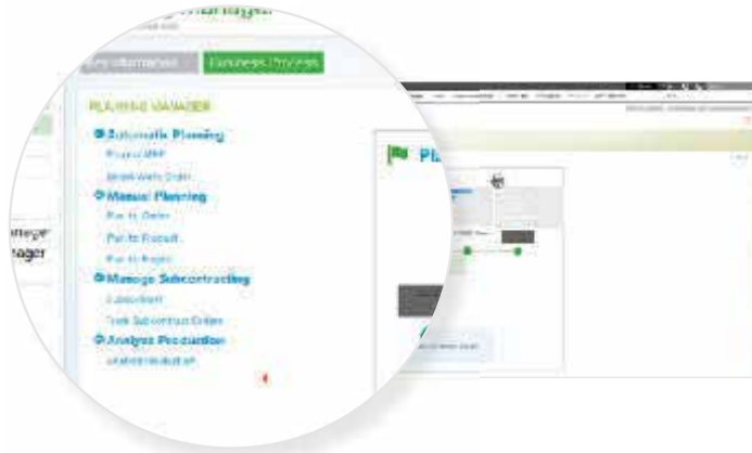
Condivisione di documenti tra team diversi