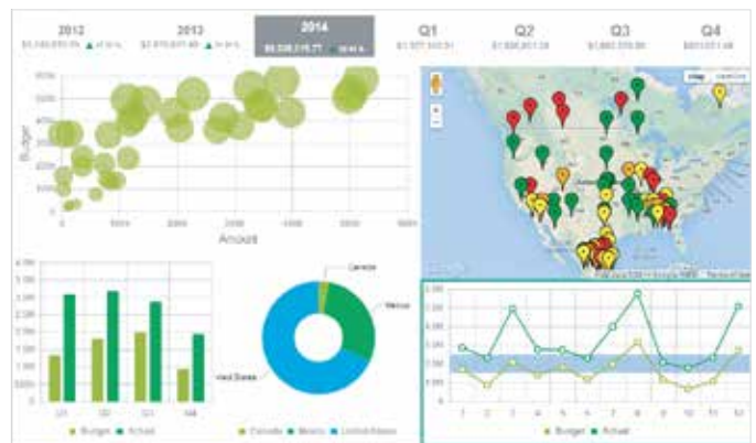
Cruscotto dei ricavi

Guida i trend e trasforma in azione la conoscenza con strumenti business object incorporati e una library di report predefiniti che centralizzano i dati e li forniscono on demand. Espandi le capacità analitiche fondamentali con opzioni di business intelligence come SAP BusinessObjects e Sage Enterprise Intelligence.